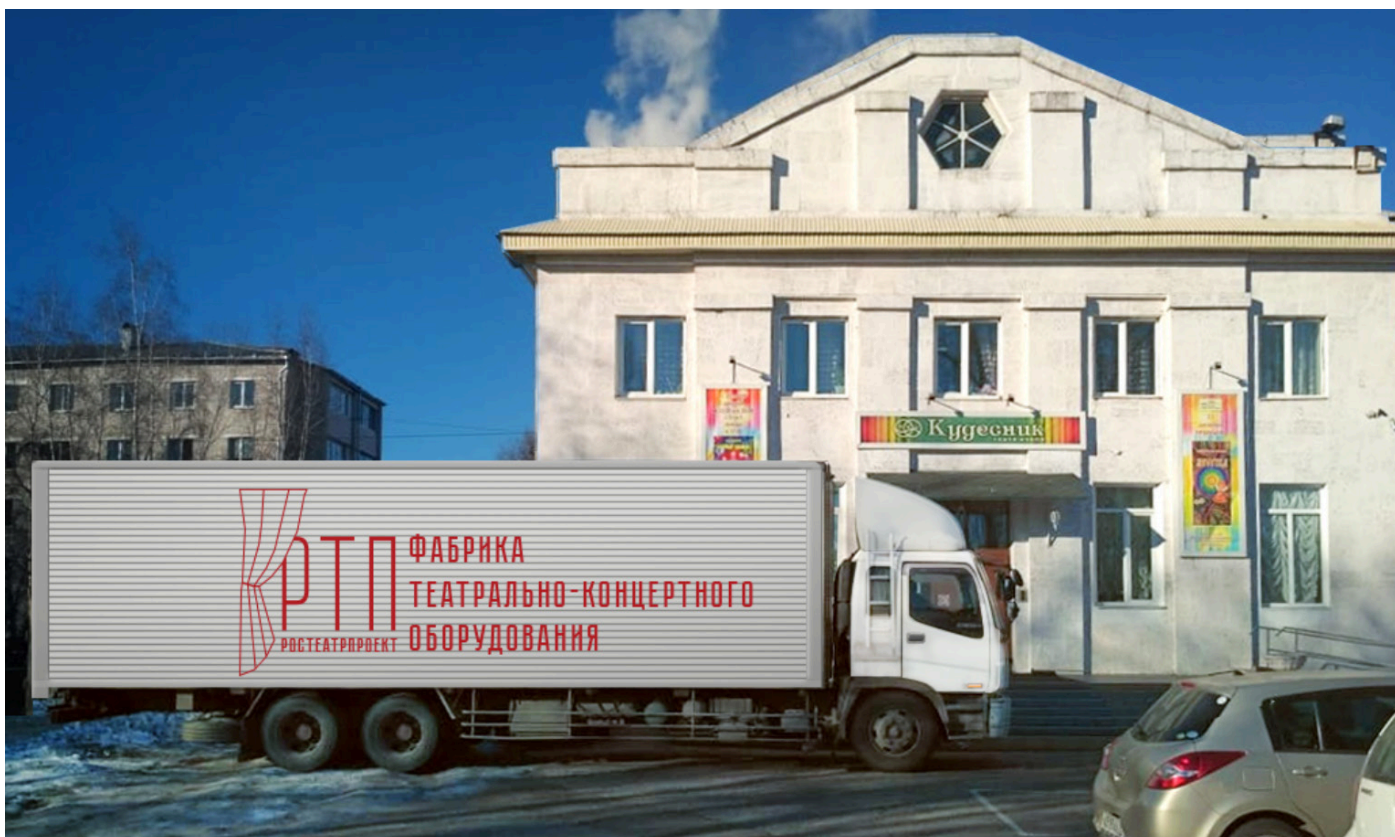
г. Биробиджан, театр «Кудесник», доставка оборудования точно в день, указанный в контракте

Мы имеем возможность сотрудничества практически в любой точке страны. Asia Music с готовностью берет на себя обязательства по доставке оборудования собственным транспортом в установленные сроки на объект заказчика. Профессиональная команда монтажников готова качественно произвести сборку и настройку оборудования. Не важно, в каком городе вы находитесь, наша первоочередная задача – качественно оказать весь предложенный спектр своих услуг и ни в коем случае не подвести нашего клиента.