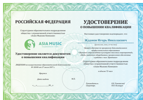
Обучение звуко- и светорежиссеров на базе собственного выставочного центра Music Expo, лето 2018 г.