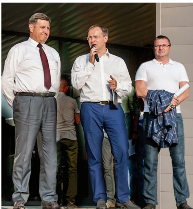
Депутат ГД РФ А. И. Голушко, министр культуры РФ В. Р. Мединский, генеральный директор ООО «Азия Мьюзик Компани» Б. Б. Рожанский на открытии Омского государственного цирка (2016 г.)